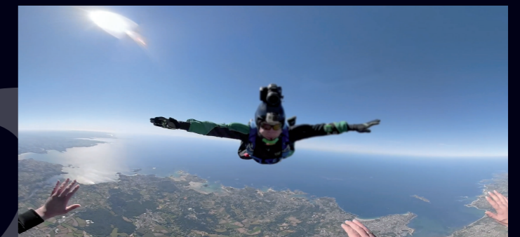
Baie de Saint-Brieuc Saut en Parachute - 7 min.