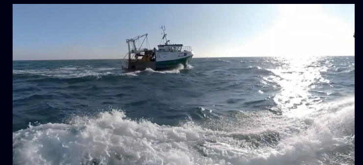
Pêche à la coquille Une journée auprès de ... 15 min