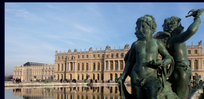
Château de Versailles – France Immersion dans la salle des glaces - 5 min.