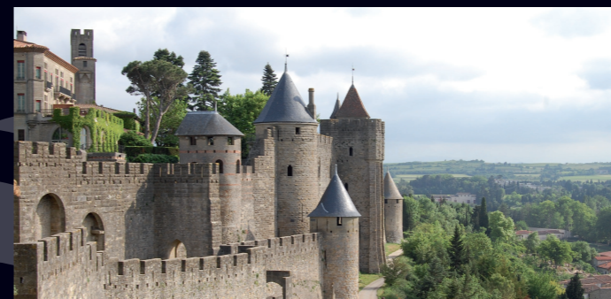
Carcassonne Castle – France Visite de château - 8 min.