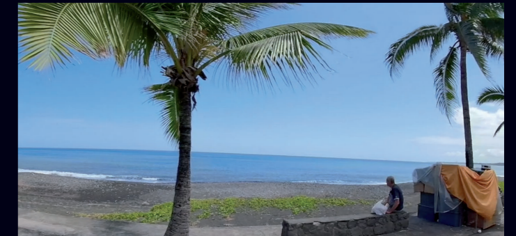
Martinique Croisière sur ... 10 min.