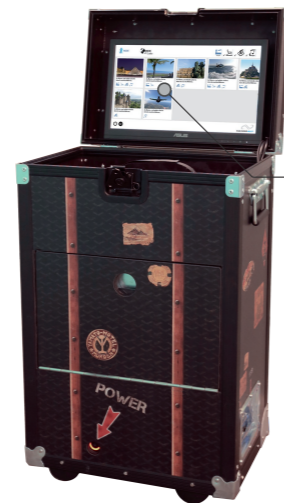
Le voyage à portée de main

Quelques minutes suffisent à la brancher, appuyer sur le bouton marche et commencer une animation en réalité virtuelle. Une connexion spécifique permet de reproduire le champ de vision de l'utilisateur des lunettes de réalité virtuelle sur n'importe quel écran HDMI.