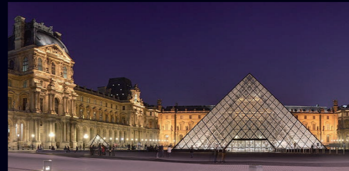
Louvre – Paris, France Visite complète ... 10 min.