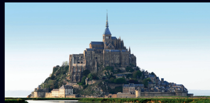
Mont Saint Michel – France Traversée de la baie - 12 min.