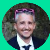
Directeur Général en charge du développement